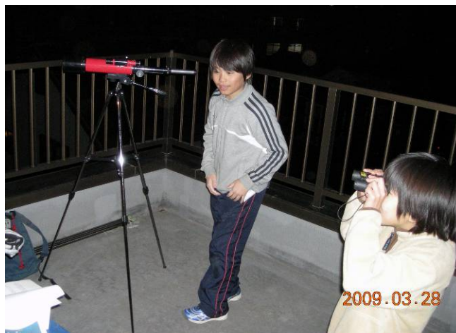
望遠鏡、双眼鏡を見えています。