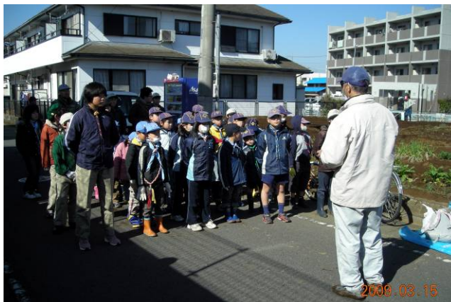
11 団川幡団委員長からの説明を聞いています

ジャガイモの種イモを植えました。カブ隊くまスカウトが畑に溝を掘りました。前日の雨で土が湿っていたので重くて苦勞していました。溝に堆肥、化学肥料の順に蒔いて少し土をかけます。11、15団のビーバー隊が準備(半分に切って、切断面に灰を塗った)して置いた種イモを溝に置いて行きました。種イモの上に溝を掘った土をかぶせて畝を作りました。手の空いたときに、ロープ結びと、基本訓練も行いました。