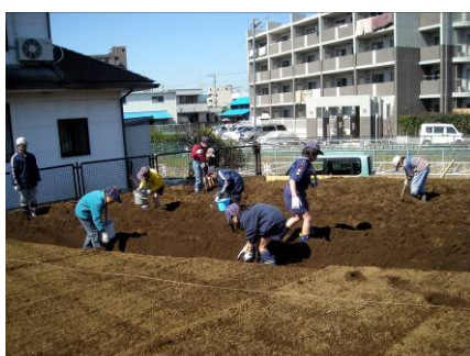
皆で肥料をまいています