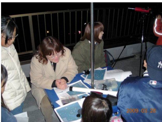
説明資料を皆で見えています。