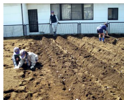
イモに土をかけて畝を作っています